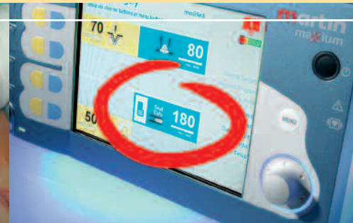
Abb. 3: Eine typische Geräteeinstellung für die in den vorangegangenen Abbildungen gezeigte Anwendung

tenkoagulation sehr viel niedrigerer Gewebe-Abschlusswiderstand. In der Konsequenz muss der Generator in der Lage sein, hohe Stromstärken zu generieren, um die für eine Gefäßversiegelung benötigte Energie ins Gewebe eintragen zu können. Solche Stromstärken können konventionelle bipolare Generatoren nicht bereitstellen. Ein Vergleich der technischen Parameter eines typischen bipolaren Koagulationsstroms mit dem SealSafe-Strom soll dies verdeutlichen.